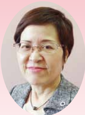
熊本県看護協会 会長