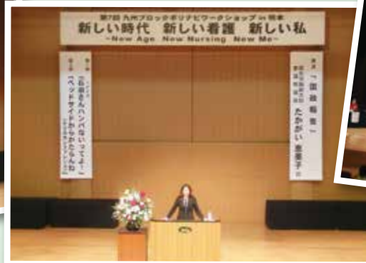
たかがい恵美子参議院議員講演