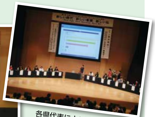
各県代表によるカンファレンス