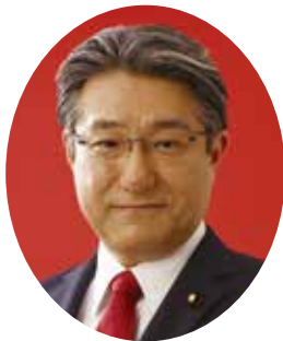
参議院議員 石田まさひろ