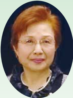
熊本県看護連盟 会長