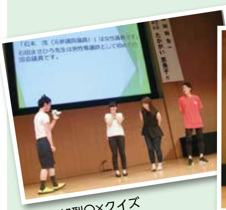
全員参加型〇×クイズ

今後、九州ポリナビは、従来の形式とは変わっていきますが、20代・30代の若手看護師が看護連盟を盛り上げていけるように活動して参ります。ご参加された皆様本当にありがとうございました。